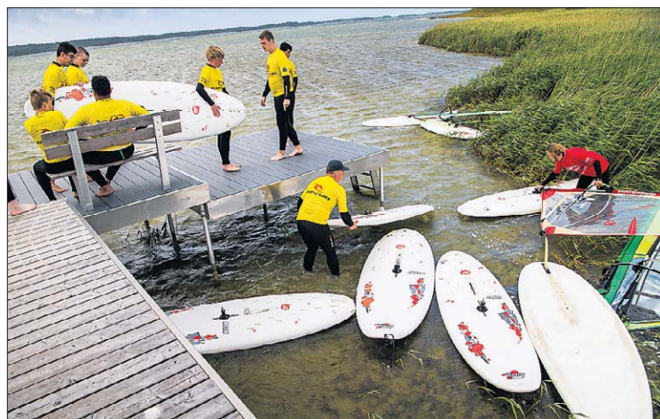
Der er ingen problemer med at bade eller vindsurfe i Vandet Sø, hvis man går et stykke væk fra rørskov. Thisted Kommune anbefaler en afstand på 200 meter til badebroen. Arkivfoto

Siden midten af juli har der været konstateret et meget højt indhold af e.coli-bakterier og enterokokker i den østlige ende af Vandet Sø, men den seneste analyse har vist, at bakterierne hverken stammer fra mennesker eller grise. Derimod er det sandsynligvis afføring fra